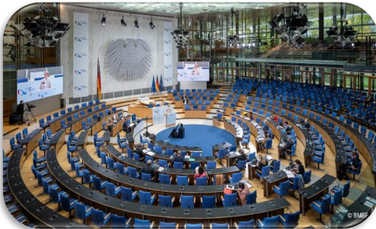
HYBRIDE KONFERENZ EU MINISTERKONFERENZ