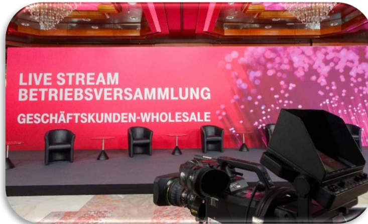
HYBRIDE BETRIEBSVERSAMMLUNG TELEKOM DEUTSCHLAND GMBH